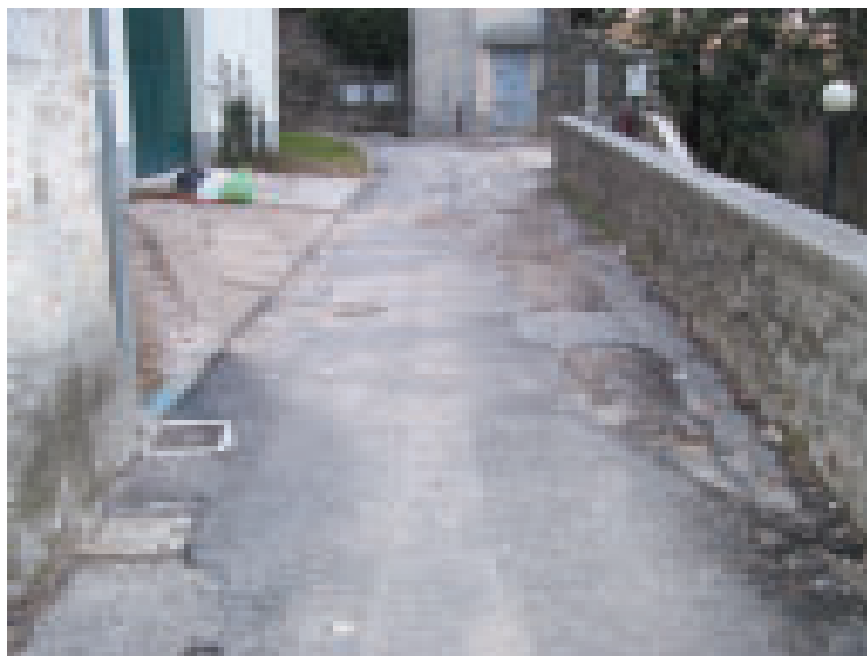
Via Mulinuss prima del rifacimento