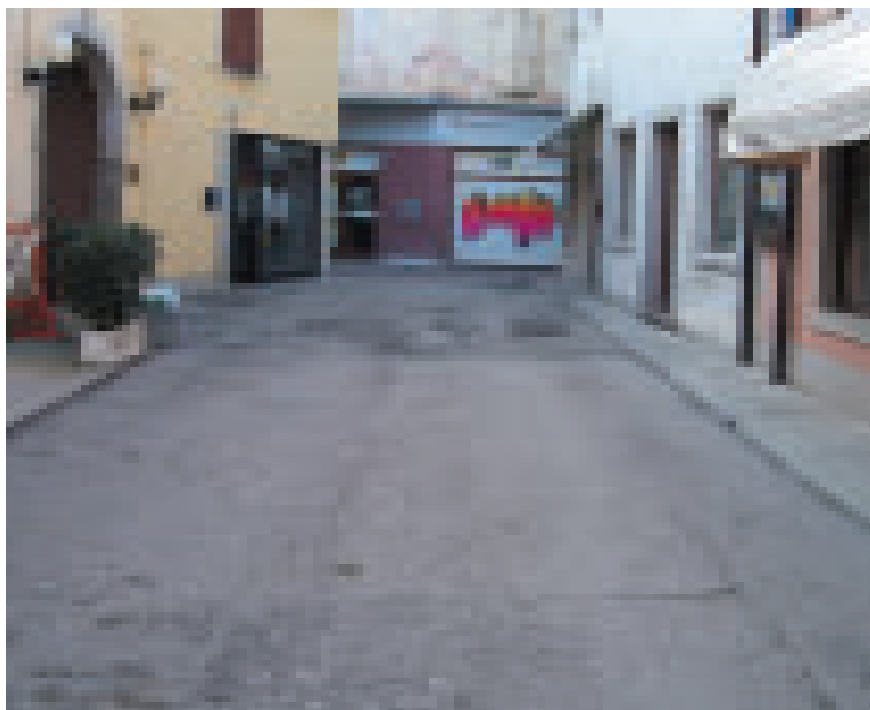
Via Manzoni prima e dopo la ripavimentazione

In tutto l'intervento, anche ove inizialmente non previste, sono state predisposte le tubazioni interrato per l'illuminazione pubblica, eliminando onerosi futuri interventi. ■